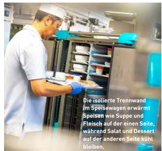
Die isolierte Trennwand im Speisewagen erwärmt Speisen wie Suppe und Fleisch auf der einen Seite, während Salat und Dessert auf der anderen Seite kühl bleiben.