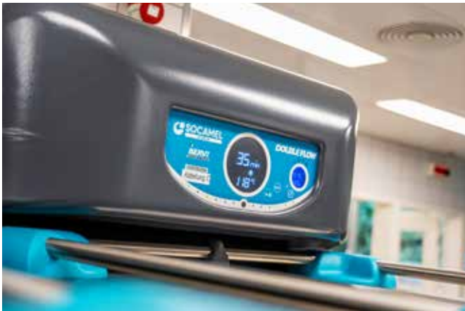
Im Engeried werden die Speisewagen angedockt und die Regeneration erfolgt analog zu den Compactserv-Wagen. Andy Wehring ist von Beat Steffens Konzept überzeugt.