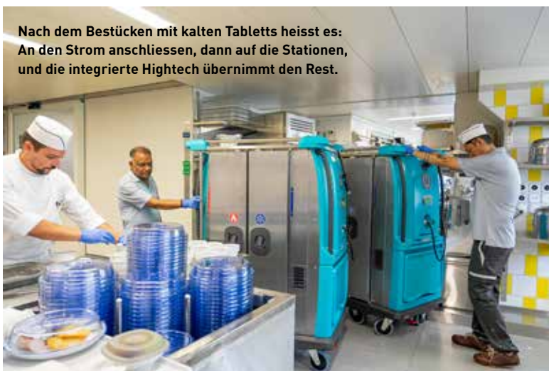
Nach dem Bestücken mit kalten Tablettts heisst es: An den Strom anschliessen, dann auf die Stationen, und die integrierte Hightech übernimmt den Rest.

So standen verschiedene Optionen im Raum, aus denen sich die heutige Lösung für die Standorte Sonnenhof und Engered herauskristallisierte. Unterstützend und wertvoll bei der Lösungsfindung war die Expertise der Steffen Gastro AG. Das inhabergeführte Unternehmen ist als Komplettanbieter für Spitäler, Heime, Hotels und Restaurants ein erfahrener Partner für Gross-