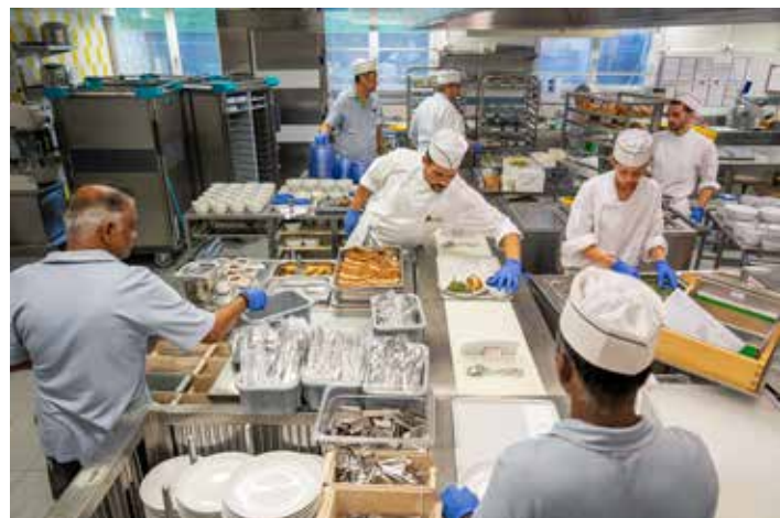
Im Sonnenhof richtet das Küchenteam die im Cook&Chill-Verfahren vorproduzierten Speisen kalt auf Tellern und Tablett an.

Die Lindenhofgruppe zählt landesweit zu den führenden Listenspitälern mit privater Trägerschaft. In ihren drei Spitälern Engeried, Lindenhof und Sonnenhof werden jährlich über 153000 Patientinnen und Patienten versorgt, davon 28000 stationär. Während der Lindenhof als vielseitiger Allrounder gilt, ist der Sonnenhof eine Top-Adresse für orthopädische und traumatologische Behandlungen auf höchstem Niveau. Das Engeried fokussiert auf Innere Medizin und Palliative Care. Die Spitalgruppe bietet neben einer umfassenden Grundversorgung ein Spektrum der spezialisierten und hochspezialisierten Medizin an. Die jeweiligen Fachgebiete wirken sich auch auf die Verpflegung aus: Während eine orthopädische OP den Appetit in der Regel nur wenig beeinträchtigt, erfordert beispielsweise ein Eingriff im Magenbereich einen neuen, überarbeiteten Speiseplan. Oder anders gesagt: Nicht nur die Liebe, sondern auch die Gesundheit geht durch den Magen. Die Verpflegung ist also weit mehr als Mittel zum Zweck. Entsprechend hoch sind die Anforderungen an die Spitalküchen der Lindenhofgruppe: Abwechslungsreiche und nach ernährungsphysiologischen Vorgaben zubereitete Menüs mit möglichst viel Eigenproduktion