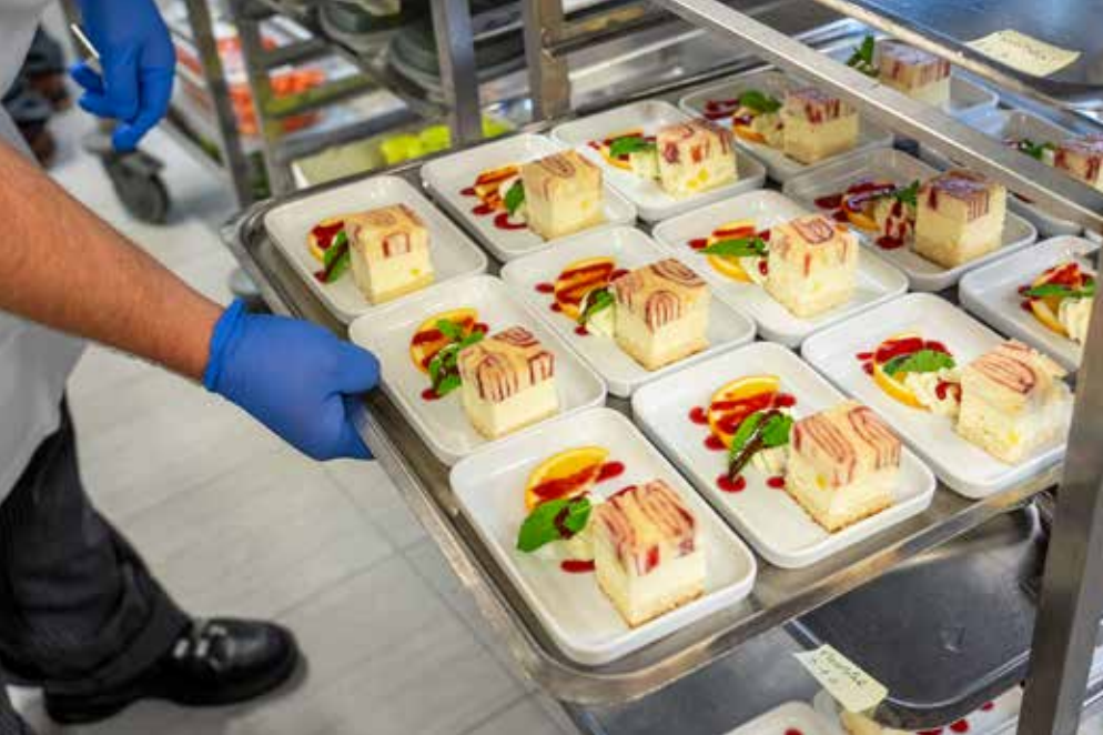
Die HACCP-Richtlinien werden in der gesamten Prozesskette eingehalten.